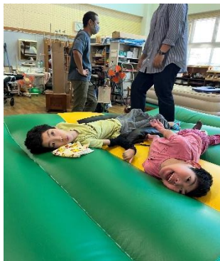
エアトランポリン