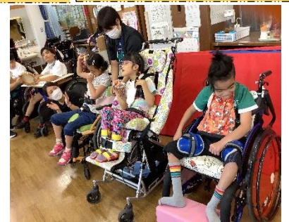
音楽鑑賞会(小学部)

6月5日(月)～6月16日(金)の2週間、小学部4～6年の児童が「進路学習会」を行いました。高等部の前期就業・生活体験の見学・体験を実施し、自分が高等部になったときに、将来に向けてどのような学習をしているのかを、高等部の先輩と一緒に交流しながら学びを深めることができました。今後も、小学部の「進路学習会」が児童の普段の活動や学習につながるような取り組みになるよう、実施していきたいと思っております。