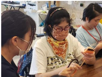
校外1 studio lifework デイサービス