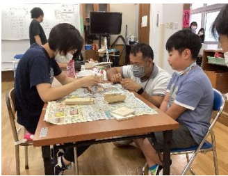
コースター作り(小学部)