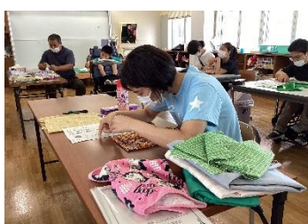
ティッシュケース作り