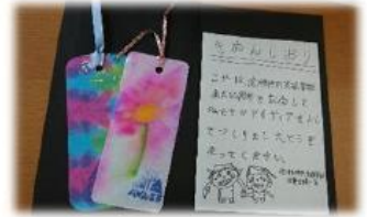
素敵な作品見つけた