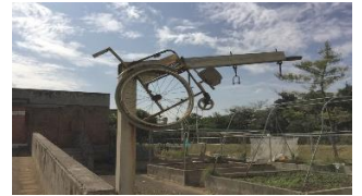
校内ギャラリー：これどこだ？