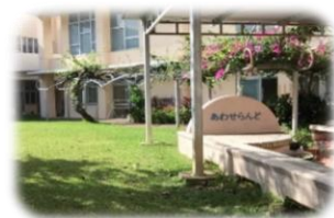
校内ギャラリー：これどこだ？