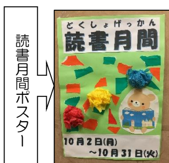
読書月間ポスター