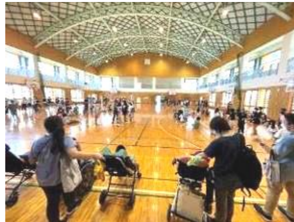
高原小との交流会

近隣の学校や地域との連携を深め、交流及び共同学習を通して児童生徒の経験を広げ、社会性や好ましい人間関係の育成をねらいに小学校、中学校、高等学校との交流を行っています。また、小学部、中学部においては、居住地校交流も実施しています。