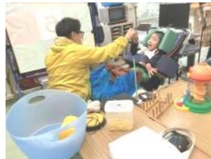
抽出での自立活動 (1対1での取り組み)