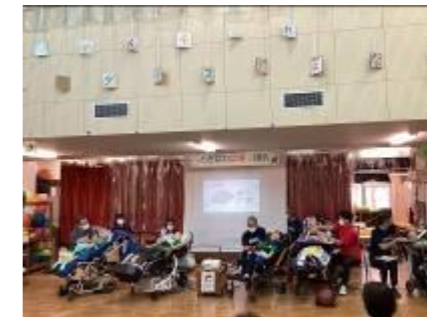
学習発表会(自立活動室)