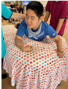
サウンドベッド体験